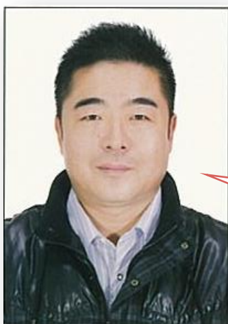
どうりん 同林先生

4月期 (1学期目) 4/13-7/6 休講: 5/4 9月期 (2学期目) 9/7-11/30 休講: 11/23 1月期 (3学期目) 1/11-3/8