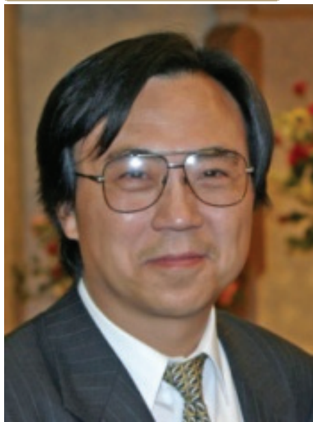
もう ゆう 毛 勇 先生