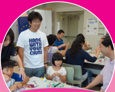
体験・交流・展示ゾーン