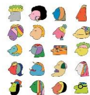
KAGAWA INTERNATIONAL ART COMPETITION 2020

外国人住民のみなさんによるアート作品展です。作品を通して、同じ地域の仲間である外国人住民のみなさんについて知り、その思いにふれてみませんか?