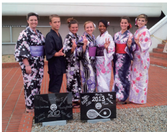
浴衣を着てハイポーズ!!

7月半ばの休日、親善大使たちを迎えて約200名の地域の人々が集まり、エルバートン祭りが行われます。会費制の歓迎会であったものを、もっとたくさんの人に気軽に参加してもらおうと、2008年の25周年行事からは地元の小学校で開催しています。エルバートンの親善大使たちがホストファミリーとともに紹介されたあと、牟礼の親善大使たちに委嘱状が渡されます。地元の団体による歓迎パフォーマンスも行われます。2013年夏は、例年のおなじみとなった銭太鼓とともに、牟礼北小学校の金管バンドが素晴らしい演奏を聞かせてくれました。