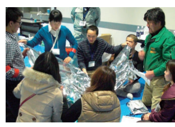
非常持出品を考える