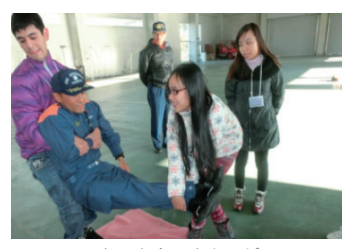
楽に安全に人を運ぶ