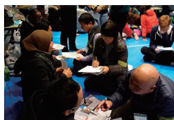
支援者チームによる聞き取り開始