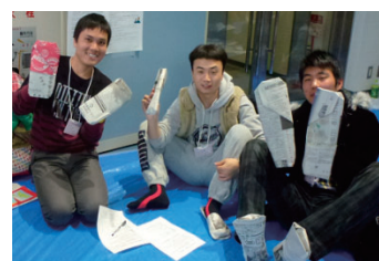
被災者チームは待ち時間にスリッパ作り

訓練実施後、外国人の参加者からは、「実用的で役立つ知識が得られた」「不安が解消された」という感想から、「常に避難の準備をしておきたい」「災害が起きたときどうするか家族と話し合っておきたい」「地震があったら避難所に行く」など、これからの行動につながる意見が聞かれ、研修の効果を実感することができました。また、支援ボランティアからは、「情報伝達の難しさを知った」「自分にできることが何かを考えたい」といった感想が寄せられました。