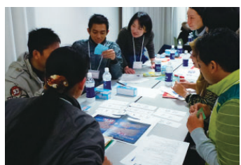
災害時のニュースの漢字読めるかな?