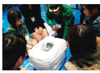
ダンボールでトイレを作る