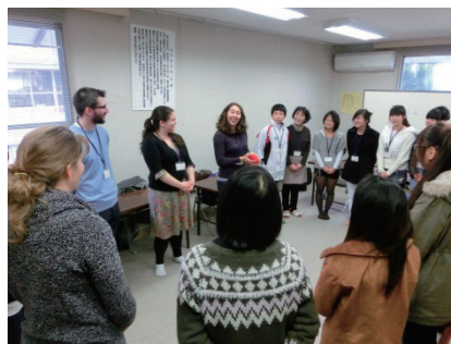
授業風景・自己紹介 Lesson Scenery / Self Introduction 课堂情景·自我介绍

この日本語講座は、毎週日曜日に無料で受けることができます。中国出身の国際交流員と日本語支援ボランティア講師と一緒に勉強します。それぞれのレベルに合わせてグループに分けるので、無理なく学べます。