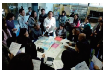
支援者チームの準備の様子