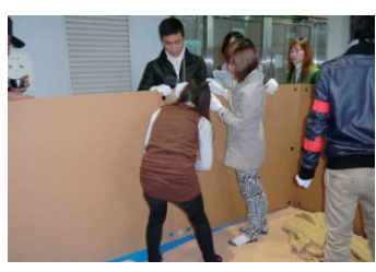
ダンボールのパーテーションを立てる