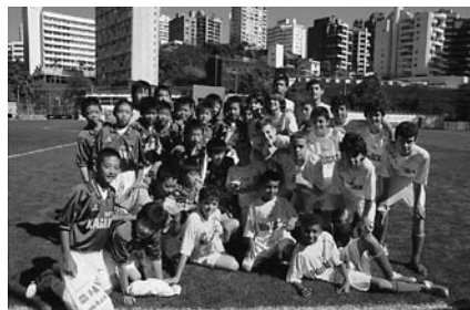
「PAEC(相手チーム名)と試合後に」

日本人ブラジル移住100周年の記念事業の一環として、(社)香川県サッカー協会選抜のサッカー少年18名とコーチら計22名が、平成20年7月24日(木)～8月1日(金)の日程で、ブラジルを訪問しました。初めて乗る飛行機がブラジル行きという少年も多い中、時差ぼけもものともしない元気な一行は、交流試合やホームステイなどを楽しみました。