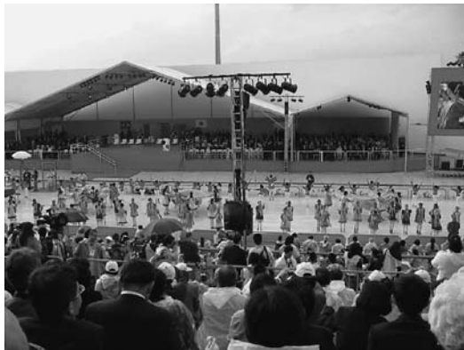
日本人ブラジル移住100周年記念式典

「日本人ブラジル移住100周年記念式典」等に出席するため、真鍋武紀香川県知事、松本康範香川県議会議長等11名の訪問団が、平成20年6月12日から6月23日まで、アルゼンチン共和国、ブラジル連邦共和国等を訪問しました。