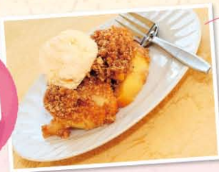
アップル・クランブル