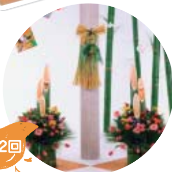
ナティビティ・セット