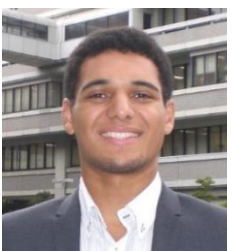
コーリ・ジョウセフ (イギリス)