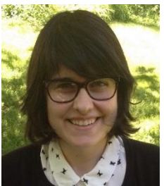
アン・ヴィエヴィアンスキ (アメリカ)