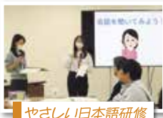
やさしい日本語研修