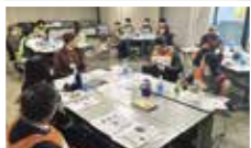
災害時における多言語情報伝達訓練