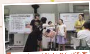
アイパルこどもにほんご教室