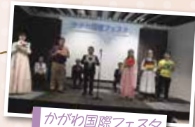
かがわ国際フェスタ