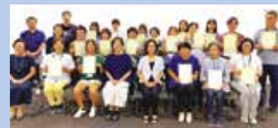
無事に修了された18名のみなさん

文部科学省 令和7年度 地域日本語教育の総合的な体制づくり 推進事業活用・香川県委託事業